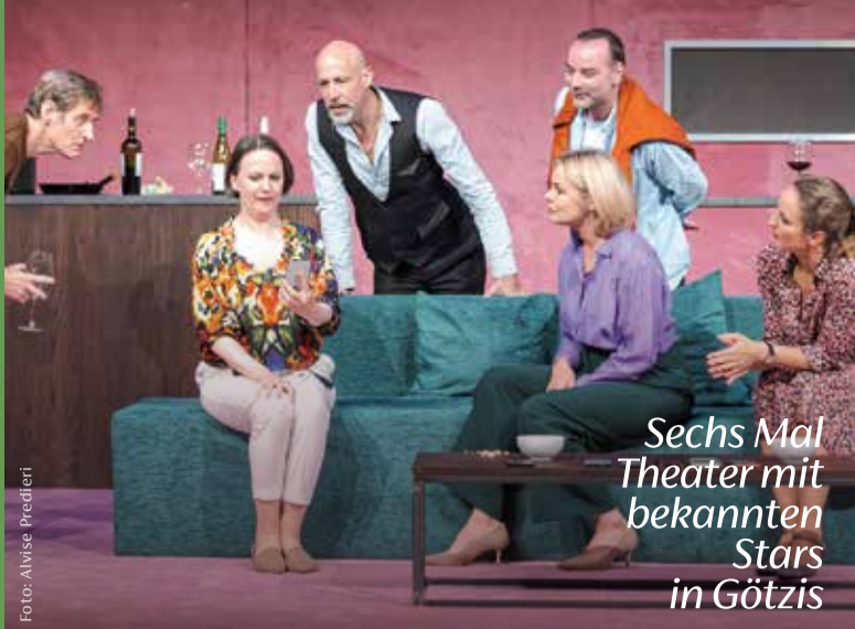
Sechs Mal Theater mit bekannten Stars in Götzis